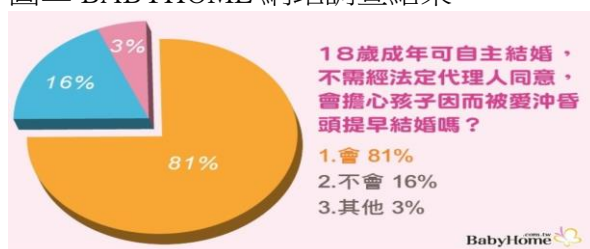
圖二 BABYHOME 網站調查結果

(資料來源：武美齡、張詩華(2020 年 8 月 19 日。取自: https://info.babyhome.com.tw )