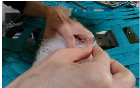
(圖六) 中獸醫為狹犬施針

由這次的訪談得知，在犬隻的針灸治療的確有其一定療效，但飼主同時也提到治療的費用頗高，會是選擇針灸治療的門檻。