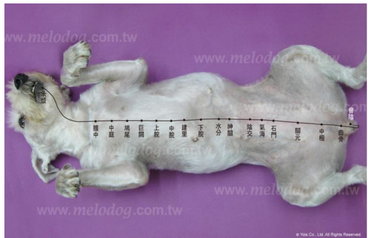
(圖三) 犬隻任脈穴道圖