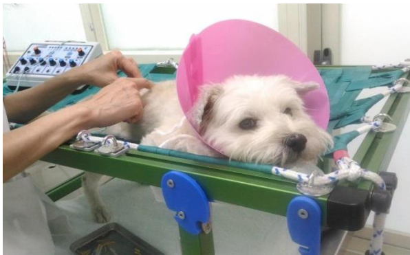
(圖五) 狹犬進行針灸的情形

手術後因狹犬完全不能行走，因此最初兩個月是一週針灸一次，後改為兩週一次，108 年 6 月時狹犬的後腳開始能施力走幾步路，或用後腳抓癢等；接著針灸的頻率變成一個月一次，除了針灸外，也搭配電針、雷射針作治療，這個過程飼主皆是聽從醫師的建議，持續針灸治療，108 年 12 月，開始恢復四隻腳正常走路，直到現在 110 年 1 月，已經不再進行針灸治療，但仍有透過針灸定期保養預防。