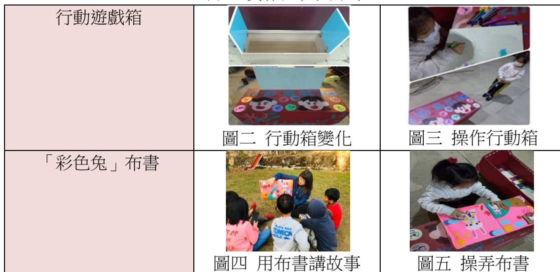
表六 實作過程與結果

在偏鄉教保中心觀察到幼兒，較常因為情緒未控管好或是無法理解人、事、物所產生的情緒原因，而導致會與其他幼兒有肢體上的衝突，所以我們從第一次實作開始製作與編排屬於他們的情緒領域課程，以故事布書、繪本及戲劇帶領幼兒了解情緒過程，後來我們發現行動遊戲箱 1 號因只有收納功能，所以增加實用性及趣味性的設計後，行動遊戲箱 2 號給幼兒帶來隨時可帶著走的情緒遊戲、可情緒發洩的小畫板及蓋子打開即可當桌子，接著第二次實作，以教具讓孩子在玩的同時學習情緒領域。實施的過程中我們發現，幼兒從我們第一次實作到最後實作的情緒表現進步了很多，他們從動手動口到願意找老師或我們慢慢協調溝通中得到原諒與理解這是我們這兩次實作中，所發現的最大改變。