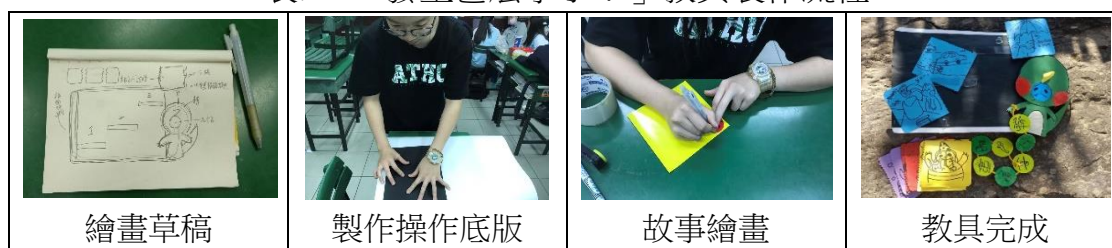
表四 「發生甚麼事了？」教具製作流程