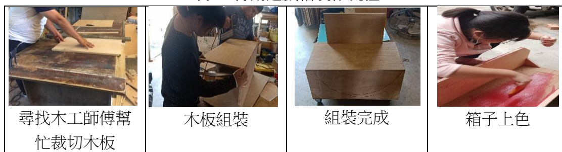
表一 行動遊戲箱製作流程

(2) 玩法：將拉線至於手上或身上即可拖行；遊戲箱內部放置以下手工製作的教玩具。在到達目的地時可將行動遊戲箱打開作為桌子使用，白板可立在桌上繪畫。