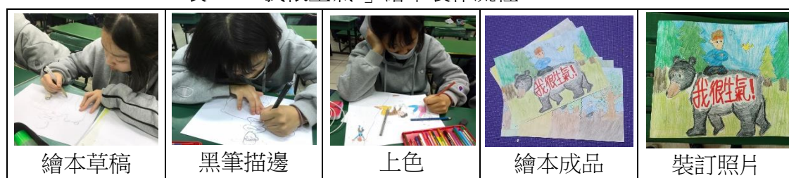
表二「我很生氣!」繪本製作流程