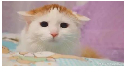
圖四：貓飛機耳的樣子

這就是俗稱的飛機耳，如圖四，此時的貓咪感到非常不安及害怕，情緒最為緊繃，進入了攻擊狀態的時候，接著會發出低吼聲、露出牙齒，用盡力氣把對方嚇跑，這個時候千萬不要靠近，以免受傷。