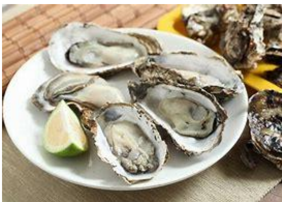
〈圖三、採蚵後品嚐美食〉