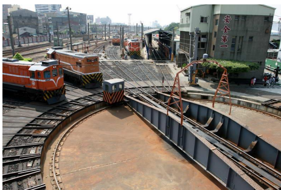
〈圖五、扇形車站火車調度轉盤〉