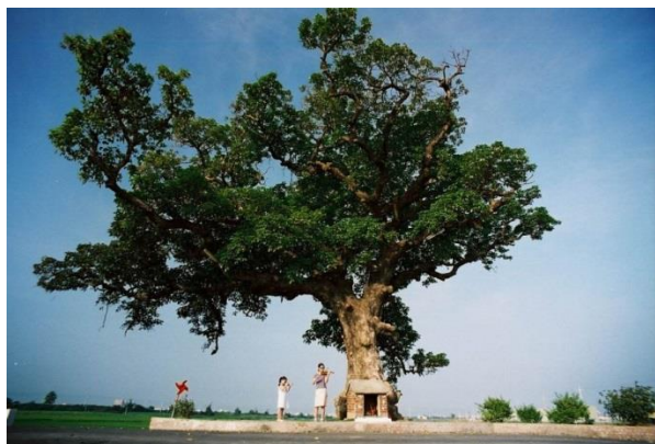
〈圖七、三春老樹處於稻田中〉

油車巷有一株三百多年老筋冬樹，據老人家說法：這株老樹為許多窮苦人家帶來財富改善窮苦生活。且筋冬樹皆為對對雙雙生長，就像夫妻一樣。所以來此求姻緣皆仍找到合適歸宿。此筋冬樹位於綠油油稻田中有種蒼桑美感，幾年前因被知名飲料廠看中拍廣告，意外帶來遊客潮。花壇鄉公所將此地營造旅遊景點吸引觀光客。