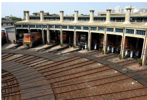
〈圖四、扇形車站火車車庫〉

是台灣僅存扇形火車庫(原台北、新竹、台中、嘉義、高雄港扇形火車庫均已拆除)，係由 12 個軌道與 1 個轉向盤組合而成，東南亞僅存扇形火車庫就位於彰化。2001 年成為縣定古蹟。彰化扇形火車庫是修理火車機頭與快速調度車頭行進方向。日本人稱為火車頭機關庫。