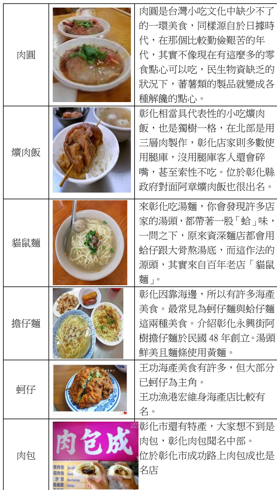
〈表一、由參考網路資料自行整理〉