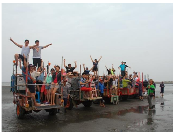
〈圖二、搭乘特殊採蚵車採蚵與欣賞潮間帶各式生物〉

每年 8 月 20、21 日彰化縣於芳苑鄉王功魚港舉行王功漁火節，所有參與彰化媽祖繞境 12 座宮廟媽祖神尊齊聚福海宮，為活動拉開序幕。