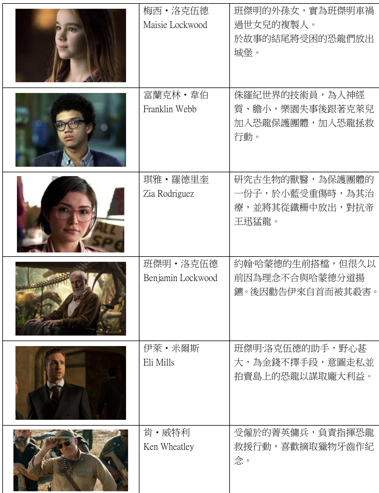
表一：電影《侏羅紀世界》人物介紹 (表一來源：研究者繪製)