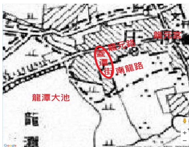
圖二：1898年龍潭地區台灣堡圖 (資料來源：台灣百年歷史地圖)

龍潭的核心街區位於龍潭大池連接到龍元宮的龍元路一帶，在以前道路還沒拓寬時很多人都會到這採買日常所需的用品。從日治時期的台灣堡圖中可以看到沿著龍元路一帶已分布著許多聚落（圖二），菱潭街位於龍潭龍元路中段，貫穿龍元路和南龍路（圖三），日治時期的龍潭庄役場（相當於現在的鄉鎮公所）曾位於此區，同時這裡也是龍潭上街和下街的分界點，過去由於地近龍潭信仰中心龍元宮，且連接龍潭大池，地理位置優越，交通方便，商家雲集，1933年，此地區成為龍潭第一市場，又被稱為「下市場」，供應居民日常生活用品，是早期龍潭最繁華的地區。