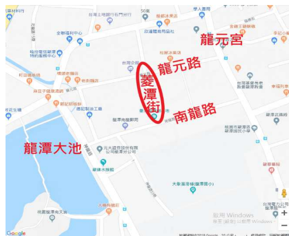
圖三：2018年龍潭地區