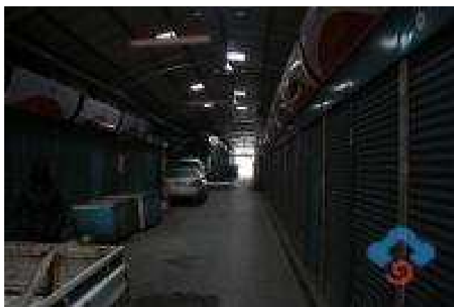
圖四：昔日舊美食街