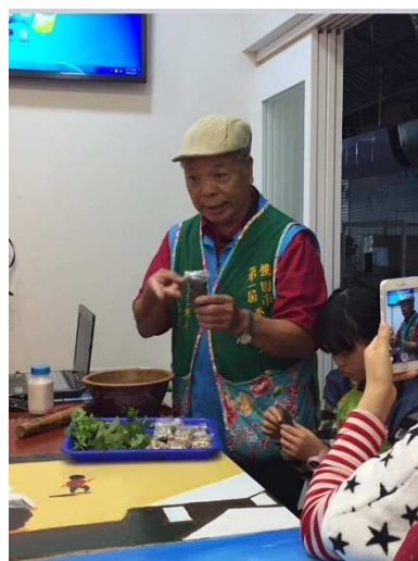
圖十一：武威學堂播茶研習