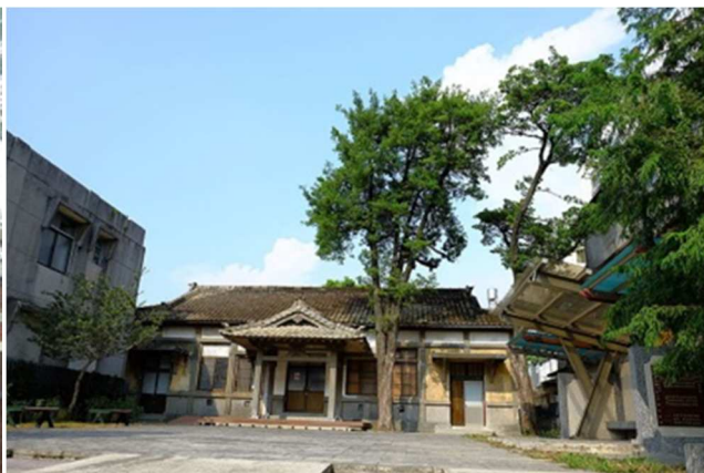
圖九：武德殿