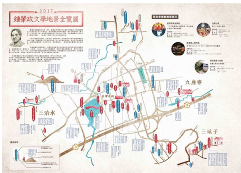
圖七：鍾肇政文學地景全覽圖

鍾肇政在 1925 年誕生於台灣省桃園市龍潭區，戰後開始接觸現代文學。一開始，鍾肇政以日文擬草稿，然後再翻譯成漢文，在 1950 年開始投稿，作品以小說為主。代表的作品有《魯冰花》、《濁流三部曲》、《台灣人三部曲》、《怒濤》、《高山組曲》、《八角塔下》。「鍾肇政的作品富含濃厚的人道精神，記錄了日本殖民時期台灣各階層的生活實況。」(桃園市政府客家事務局，2015) 對本土文學和客家文化都有極深的影響。為了讓龍潭地區的居民更認識這位作家，菱潭街的街道一側設置鍾肇政的文學作品介紹看板，讓來往於東龍路和南龍路之間的民眾，更容易認識鍾肇政先生的文學作品，增添了不少文藝氣息。