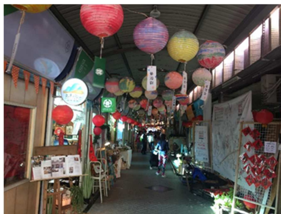
圖五：今菱潭街