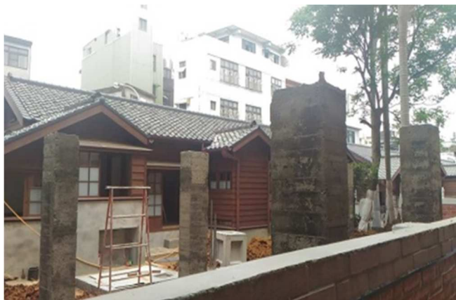
圖八：日式宿舍

興建於日治時期昭和 5 年（1930）左右，為當時警察習武、柔、劍道的重要場所。曾經成為廢棄空屋，現今規劃為龍潭客家書院。（圖九）