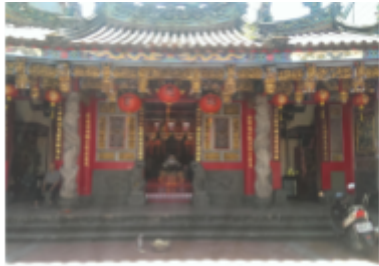
圖五、鄂王社區——昭應宮。

王社區內。隨著昭應宮的完成，匠師們也藉此進駐鄂王社區。加上當時的婚喪喜慶的儀式常使用到傳統藝品，讓鄂王社區的經濟逐漸繁榮了起來，吸引更多外來人口遷移過來發展。