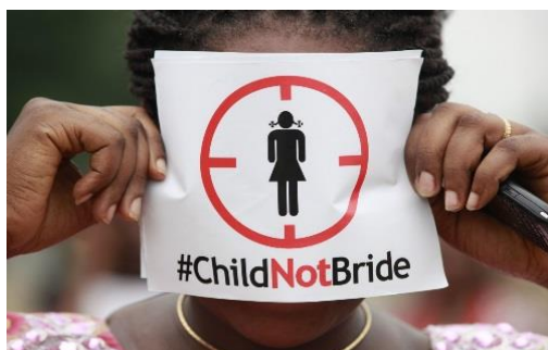
圖二：助養兒童計劃。

現在已經有許多組織，例如Oxfam、Free the Children、Girls Not Brides等，投入阻止童婚的行列，提供學齡女孩教育。目前在童婚盛行的國家裡，透過「助養兒童計劃」，使女孩們在營養、教育及健康方面得到幫助，不再淪為童婚的犧牲品。期望透過深根社區服務，建立安全與性別平等的校園環境，補助學用品及制服，訓練師資引進課程和教材，提供改善家庭生計方案，幫助所有孩子能持續求學，讓兒童透過教育能明白自身權益，懂得保護自己遠離童婚危機，擁有追求並實現夢想的機會。