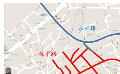
【圖4】永平路和保平路分布範圍

以往樂華夜市內的住宅交易量偏少，主要攤販聚集的永平路，住宅均價每坪40萬，隔壁保平路每坪卻有45.4萬行情【圖4】。一旦樂華夜市熄燈，永平路的房價應該有機會比照保平路的住家行情 2 。所以許多攤販覺得夜市居民主要希望夜市拆遷的原因是想提高房價。