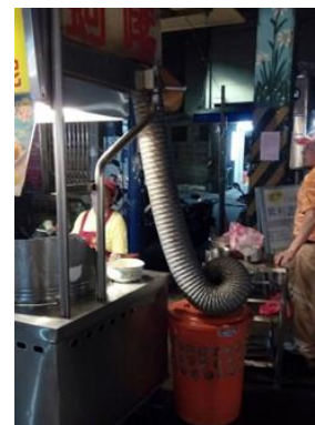
【圖6】熱炒、油炸店的抽油煙機

居民C：「其實夜市油煙方面的改善還頗有成效的，而且現在有使用管子將煙吸到桶子裡【圖6】。」