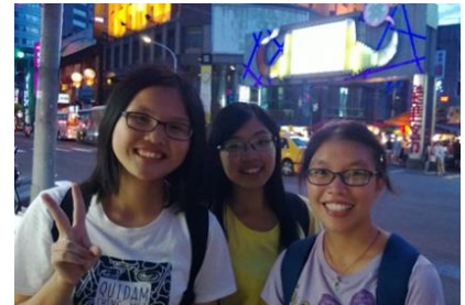
【圖 1】 實地勘查樂華夜市

藉由實際勘查，探討樂華夜市的現狀、印證居民與攤販的衝突點以及以寧夏夜市為例的改善方法。