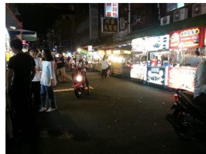
【圖3】樂華夜市的路十分寬敞

攤販乙：「樂華夜市這邊人口蠻密集的，又在住商混和區，客源很穩定。而且這裡路很寬敞，可容納很多人【圖3】。」 樂華夜市位於全臺人口密度最高的地方—新北市永和區 1 ，夜市附近有許多住宅和學校，客源多又穩定。且夜市路寬12米，十分寬闊。但是攤販也有指出樂華夜市的缺點。