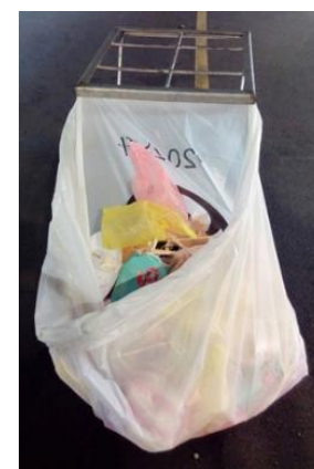
【圖7】樂華夜市的垃圾桶

樂華夜市內的鄰長：「管委會會請人在夜市收攤後來清潔，並給他們清潔費，而且樂華有三個垃圾桶，足夠遊客丟垃圾而不會亂丟。」 但有時在人潮眾多時垃圾桶還是會有垃圾滿出。