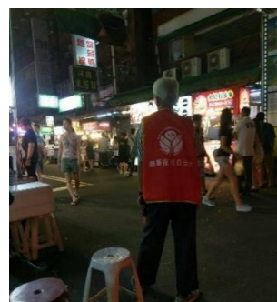
【圖 9】樂華夜市的交通指揮

攤販 B：「因為住戶居住在夜市內，他們都會騎車、開車進來，行人在夜市裡非常危險。」