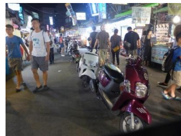
【圖 10】遊客常把機車停放在樂華夜市的道路中間

前溪里里長：「原本大家會在樂華夜市內的路中間停機車【圖 10】，現在警察會開單，亂停機車的現象有減少。…現在一年會有兩次消防演習，……，當救護車、消防車要進入夜市時，攤販會迅速讓位。」