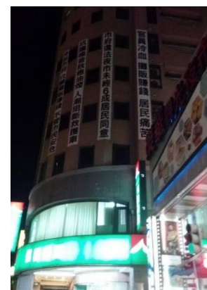
【圖5】居民貼的抗議布條

由此可見，歷史悠久的樂華夜市不僅陪伴了居民無數個歲月，在對話的過程中我們也能感受到居民與攤販對樂華的情感，但反對夜市的居民也有他們的原因。