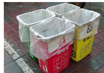
【圖 8】寧夏夜市的垃圾桶

此外，寧夏夜市的垃圾桶有分類【圖 8】，而且多數店家都使用環保餐具，不僅減少了垃圾，更保護環境。因此，我們建議樂華夜市可以增設垃圾桶或在人潮眾多時請清潔人員更加頻繁地收垃圾，並以環保為改善目標減少夜市帶來的環境汙染。