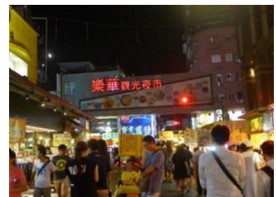
【圖 2】人山人海的樂華夜市

樂華夜市位於新北市永和區永平路, 範圍擴及保平路十八巷、保福路一段, 起點為永和路路口, 終點為中山路路口。它離捷運頂溪站步行不到 10 分鐘, 因交通便捷而吸引許多遊客前往, 進而帶動地方的繁榮。