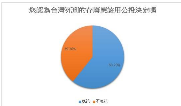
圖二 您認為台灣死刑的存廢應該用公投決定嗎

根據此圖表可明顯得知，大多數人民對於政府現今對犯罪的處理方式並不滿意，且希望我國政府能對此做改變。