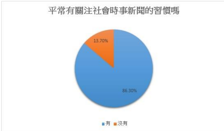
圖三 平常有關注社會時事新聞的習慣嗎