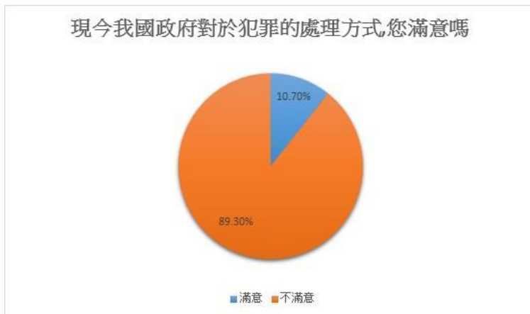
圖一 是否滿意我國政府對犯罪的處理方式

在受測的 262 人中，有三成為男性，七成為女性。其中，受測者年齡以高中居多，再者為國中，研究所及大學受測者則占少數。