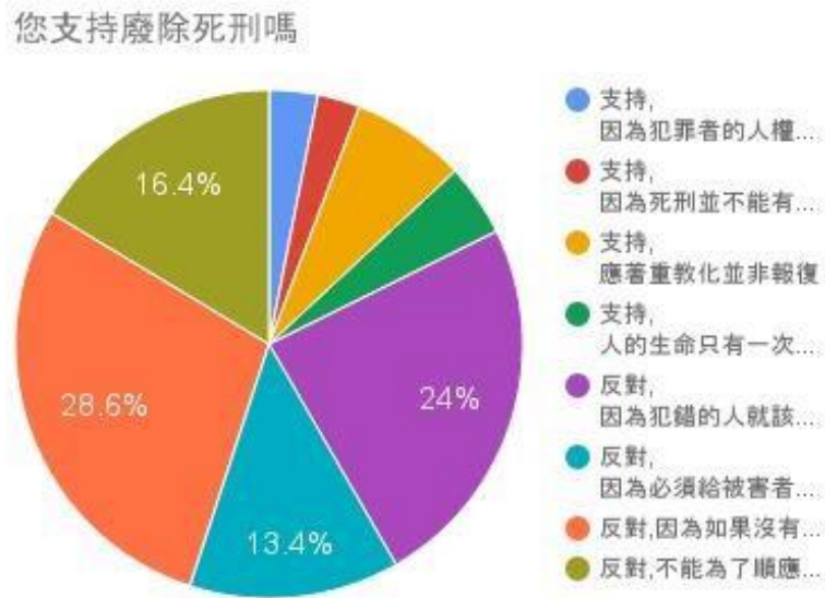
圖四 您支持廢除死刑嗎

由上方圖表得知，人民支持廢死與反對廢死的原因各不相同。其中反對占大多數，且人民希望維持死刑的原因又以若無死刑，往後犯罪率堪憂及認為犯罪者須對自己負責居多。