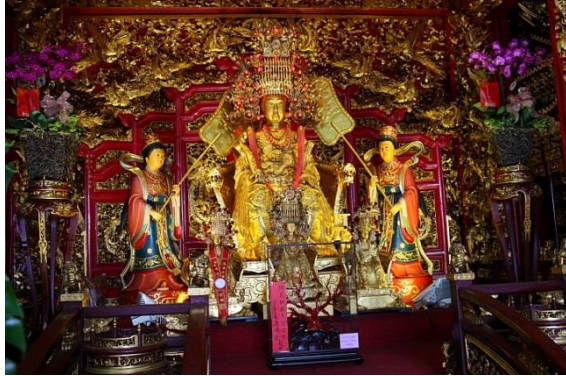
圖八，金玉滿堂媽祖

向的信眾；步履再向右滑動，金媽祖的靦腆微笑是帶著不捨眾生仍在苦海中流轉。不論能否看到金媽祖以不同程度的笑容迎接信眾，在這樣虔誠注視的過程中，就像啟發信徒在面對任何難題時，秉持正念，微笑以待，放下執著，嘗試以不同方式或不同角度去面對，願望終能達成如圖八所示。