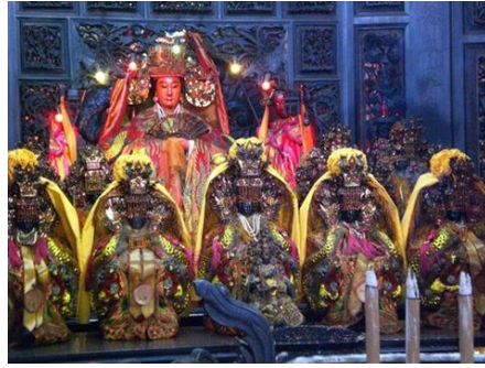
圖六，湄洲媽祖 資料來源：南方澳南天宮網站