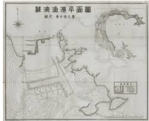
圖一，以前的南方澳

南方澳最早拓墾歷史是於清朝嘉慶年間，而日治時期，日本政府將此處開發為漁港，成為台灣東部的漁業重鎮，日治時期由日人修築成為一個完整的漁港，歷史可作為台灣漁業改革的典範。也因豐富的漁業資源吸引各地人口遷入成為東台灣最繁盛的漁港，南方澳漁港有發展商港與軍港、豐富的海洋資源，產生出南方澳漁村獨有的「討海文化」。