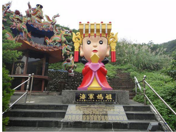
圖九，Q版媽祖

進安宮在蘇澳一共有兩間，一間是南方澳進安宮擁有全台為一的寶石珊瑚媽祖，另一間是北方澳進安宮，這裡也有全台唯一的 Q 版海軍媽祖，因為地理位置非常特別，位在重要的海軍基地內，所以並不是隨便就能入內參拜，有一定的開放時間，而且平日只開放團體預約，只有假日接受一般散客入內參觀海軍媽祖被供奉在「進安宮」如圖九所示。