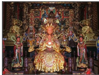
圖四，寶石珊瑚媽祖