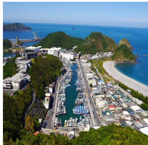
圖二，南方澳現況

南方澳位於蘭陽平原南端盡頭蘇澳灣內，因外海黑潮行經之處洄游魚類豐富而形成漁場，灣內沿岸有三個聚落，蘇澳港灣內有兩大漁港，北為北方澳軍港，南為南方澳漁港、位在中央（灣的西側）的是蘇澳，南方澳在清治時期因地理環境逢南風盛行時，可作為漁船停靠的港灣在地理環境上又是一個灣澳地形，又有舊名「南風澳」之稱，南方澳除了是台灣三大漁港之一，同時也是東部遠洋漁業的重要基地。也因為這裡從事漁業的人口高，所以媽祖亦為當地重要信仰之一。