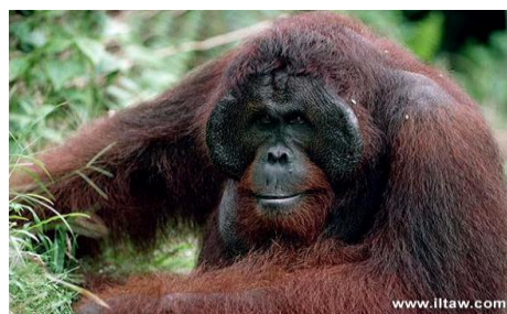
圖二、婆羅洲猩猩 (註三)