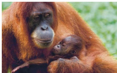
圖三、紅毛猩猩寶寶(註五)

剛出生的紅毛猩猩寶寶總會緊緊依偎在媽媽的胸前(如圖三)，受到媽媽的細心呵護與照顧，然而當偷獵者為了取得可愛的猩猩寶寶，會不惜的殺掉媽媽跟兩至三隻一起活動的成年或半成年的紅毛猩猩。因為走私是非法的，所以紅毛猩猩寶寶被關在極為狹小的箱子裡，裡面沒有水、沒有食物也沒有四肢可以伸展的空間，裡面的紅毛猩猩飢餓又脫水，走私到另一個國家時，一大半的紅毛猩猩寶寶已經死去了，剩下少部分的，也將會面臨飼養不當而絕望的死去。