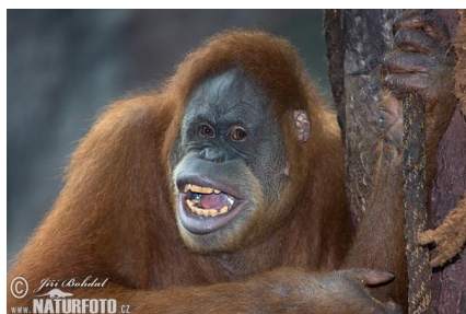
圖一、蘇門達臘猩猩 (註二)

主要吃生果、樹枝、樹皮、豐富的礦物質的土壤及鳥蛋，會吃昆蟲但是很少數，婆羅洲猩猩在地上的時間相對與蘇門達臘猩猩久，因為它們不須躲避在地上的大型獵食者，兩種類猩猩生活方式差異與特性比較參閱(表一)