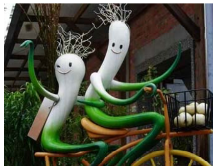
圖二、宜蘭縣三星青蔥文化館

宜蘭三星地區休閒農業園區涵蓋了三星鄉與大同鄉，因水質清澈，使三星地區成為高品質的農業園區。三星鄉所生產的農產品眾多，如：青蔥、白蒜、銀柳、上將梨、玉蘭茶……等等，質優味美，深受大眾的喜愛。