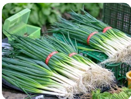
圖三、宜蘭縣三星蔥

在日本古代，蔥是大雅甚至是神聖的象徵，在一些日本神話中，蔥因其「亭亭玉立」，而且青白相間，所以被作為仙女或者神靈侍女的化身，是文人雅士喜歡吟咏的對象，而「賞蔥」更曾被視為一種風雅。另外，日本神道教對蔥極為尊重，認為蔥的生命力強，是「有靈性之物」，所以一旦開花更是吉祥的徵兆，能夠避邪驅妖，也因此日本天皇乘坐的 12 人抬轎子中，一種是雕著鳳凰，另一種便是雕著大蔥花。