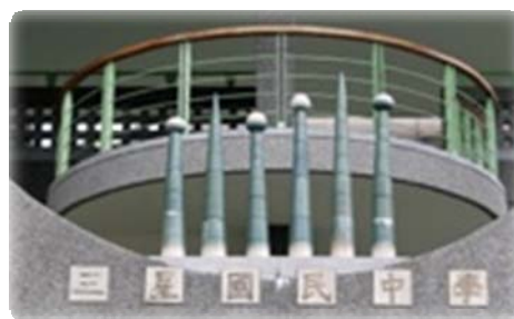
圖四、宜蘭縣三星國民中學

說明：這是三星過民中學最具代表性的建築物，藝術家陳建華先生想藉由作品，來提醒同學們感恩家長以及農民的辛勞，建立鄉親的自信及對土地的認同感。