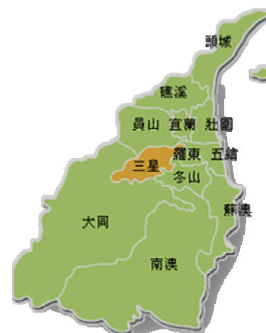
圖一、宜蘭縣行政區---三星鄉

因為三星鄉是蘭陽平原與山地及河川的交匯點，也是平原地勢最高的地方，在這種自然地形及環境的影響下，早期的三星鄉為河川氾濫的地方，整片土地被呈網狀四散流的蘭陽溪所覆蓋，形成一個大「溪埔」，其洪水頻仍是其特徵，而早期前來拓墾的人，即在網狀散流的河道中，選擇積沙成洲的土地上進行引水灌溉、種植稻米、花生及甘蔗的工作，也因此自來即是山地原住民與平原居民貿易來往的地方，同時也是族群和文化衝突與交流的重要地點，加上戰後前來此地拓墾土地的人民，三星鄉自古以來即是多族群多衝突的地方，而其文化的痕跡也處處可見，在宜蘭是別具一格的。