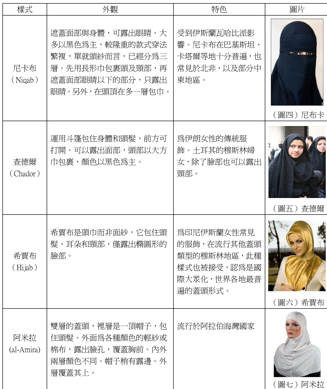
表一、各種樣式的穆斯林服飾