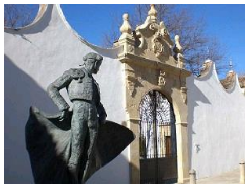
➤ 圖三 隆達鬥牛士像