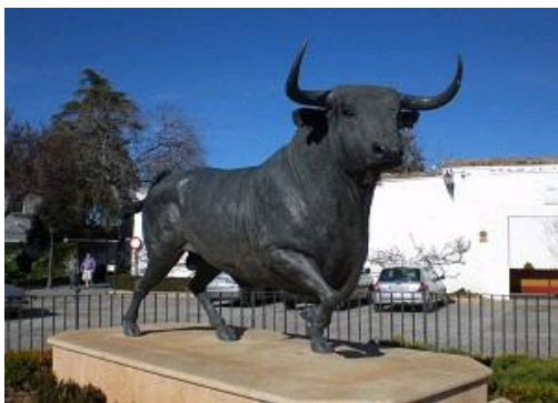
➤ 圖二 隆達鬥牛像