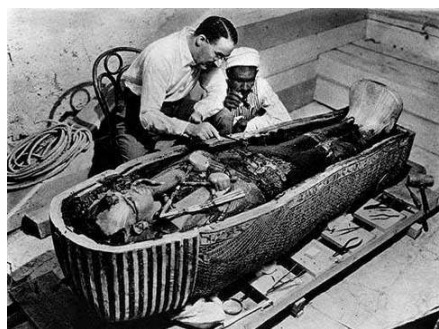
圖七：研究人員發現圖坦卡蒙之墓。（註十六）

第三具石棺內有一木乃伊，雙手抱金，交叉在胸前，被縫在亞麻裹屍布上，雙手各持鞭子和權杖，這是冥神奧西利斯的象徵。在外層亞麻裹屍布上有一金飾。木乃伊發現時的保存狀況很差，因為大量使用油的關係，造成碳酸化的結果。在包裹木乃伊的繃帶中亦發現了 150 個護身符。