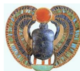
圖二：圖坦卡門墓中發現的聖甲蟲像。（註十二）

在木乃伊製作的最後階段，一般還要在屍體和亞麻布之間放護身符（符咒）和蜣螂雕像（又叫聖甲蟲像）以發揮保護作用，上面刻有祈禱語。許多護身符由寶石組成，上面刻