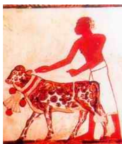
圖四：古埃及人製作動物木乃伊。（註十四）

朱鷺和狒狒被製作成木乃伊是因為它們象徵著托特天神，這是埃及神話中的月神，具有智慧和寫作能力。猛禽象徵著何露斯，這是埃及的太陽神，而貓象徵著保護女神貝絲蒂。貓是很容易裝入木乃伊容器的優先選擇。研究人員評估稱，在古埃及動物木乃伊製作巔峰時期，製作了數百萬計的木乃伊貓。在 19 世紀末，這些木乃伊貓甚至以農業用途而被販賣，一家公司購買了大約 18 萬隻木乃伊貓，重量達到 38000 磅以上，該公司甚至將這些木乃伊壓成細粉，作為肥粉撒在英國農田之中。聖獸墓城有一些祭堂（保存最完好的一座是以托勒密一世為名），還有狒狒石棺以及擺滿甕的長廊，甕裡有兩尊朱鷺木乃伊。