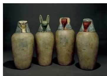
圖三：卡諾皮克。(註十三)