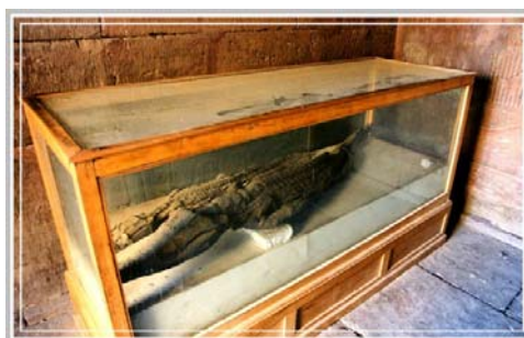
圖六：鱷魚木乃伊。（註十五）

2. 公牛木乃伊：開羅南方的孟斐斯信仰著牡牛神阿匹斯（Apis），在此地按膚色形體選出牛隻，以作為阿匹斯神牛而加以飼養，一旦神牛死了，就把牠做成木乃伊放進棺木，安置在神廟地下的墓室裡供奉。【註六】