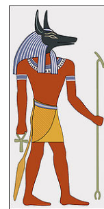
圖一：阿努比斯神。（註十一）

神話中的人物阿努比斯神（Anubis）是奧西里斯的塗香油防腐者，因而成爲塗香油防腐者的保護神。這個胡狼面形的神將死者帶入另一個世界，並守護他們的墳墓。【註二】