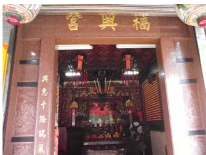
〈圖九〉福興宮

台灣地區名為福興宮的廟宇多奉祀土地公〔福德正神〕，但此地的福興宮則供奉丁府八千歲。