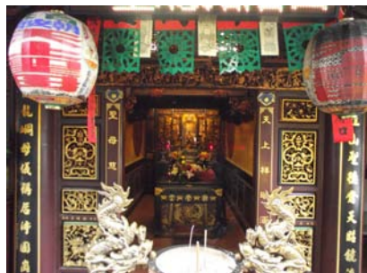
〈圖六〉朝安宮

每逢農曆 3 月媽祖誕辰或是廟會活動時，有來往的中南部廟宇都會北上一同參與，吸引了大量信徒以及文史工作者前來，為當地最有名的廟宇。