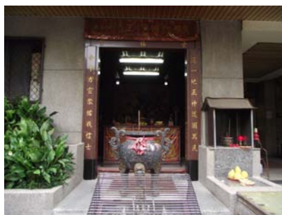
〈圖十一〉景福宮