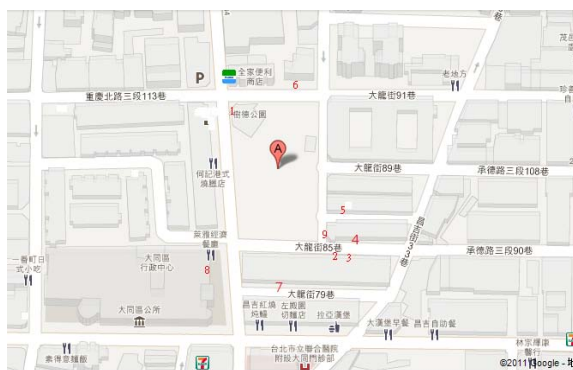
〈圖三〉樹德公園週邊廟宇分布圖，作者以 Google 地圖為底製