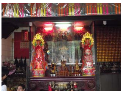
〈圖十二〉民聖堂供奉的中壇元帥

主祀中壇元帥哪吒。哪吒本為佛教的神明，後與道教結合，成為佛道皆祭拜的神明。中壇元帥負責率領鬼神守宇附近的廟宇、民眾，並驅除地方邪魔。