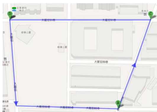
〈圖一〉樹德公園調查範圍

我們的研究範圍主要在大同區斯文里樹德公園周遭，由大龍街〈120 公尺〉、大龍街 79 巷〈100 公尺〉、大龍街 91 巷〈150 公尺〉與昌吉街 33 巷〈130 公尺〉所圍繞的四邊形區域，四邊形的總邊長約 500 公尺，面積則約 15000 平方公尺。