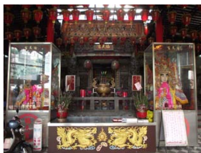
〈圖四〉協天宮

7 我們曾向廟方人員詢問：「協天宮是否會因為不遠處有大龍峒保安宮而導致香火減少？」 8 廟方人員的回答是：「不同的神明各司其職，相信的自然就會來拜，所以不會有爭奪信徒或是分走香火的問題。」