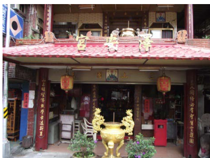
〈圖五〉澤安宮

主祀三山國王，廟齡大約 40 年。澤安宮的特別之處在於當地是傳統的閩南社區， 9 卻有一座祭拜客家神明的廟宇，令我們非常好奇。經過詢問打理廟務的人員，得知是民國 40 年代中南部水災時 10 ，準備上台北的移民發現神尊流落在外，認為神尊在外漂流不好，便將其帶上來台北供奉，並且認雲林縣東勢鄉的賜安宮為主廟。