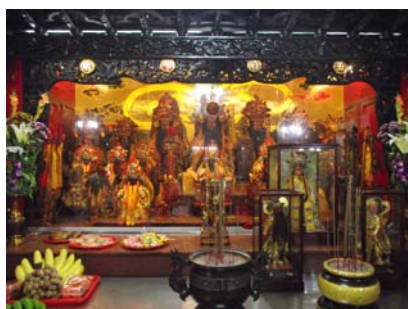
〈圖十〉行天府供奉的七尊王爺

主祀五府千歲。原本與順天府是同一座廟，後因管理人的理念不同而分家，祭祀的神明同樣為七府王爺，也一樣以李府王爺為主祀神明。