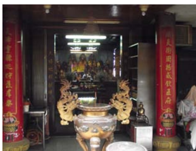
〈圖七〉順天府

順天府的主廟是雲林縣台西鄉的進安府，此廟的特殊之處在於它雖名為五府千歲，實際上卻供奉了七尊王爺，分別是朱、李、池、抄、吳、張、莫府王爺，其主要原因是順天府的主廟進安府位在該庄的中段，而要迎上台北供奉時必須有庄頭的王爺保護，因此連同庄頭的安西府的王爺一同迎上了台北。進安府祭祀的王爺為朱、李、池、抄、吳五府王爺，安西府供奉的則為張、李、莫三府王爺，總數為八尊，不過由於其中的李府王爺重複了，因此共供奉七尊王爺，其中主祀為李府王爺。