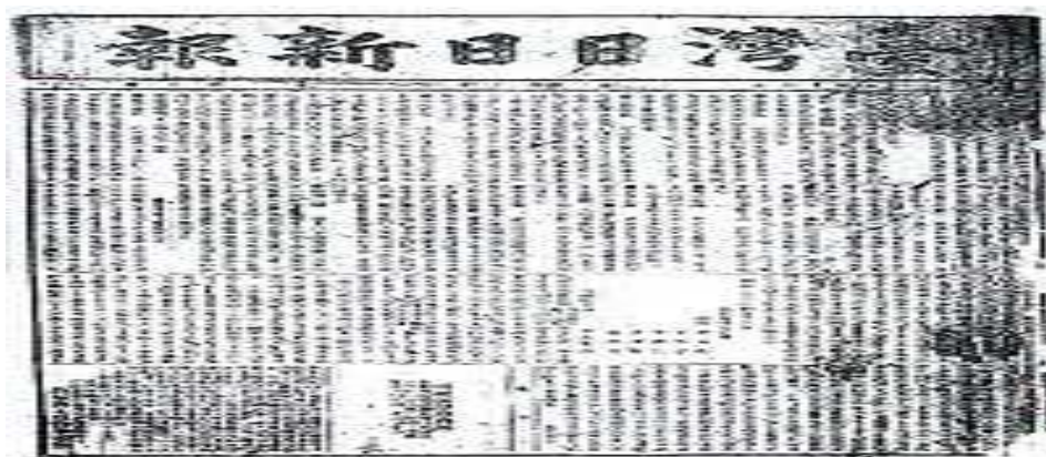
(圖二)《台灣日日新報》創刊號剪影

其中台灣日日新報，則是官方御用報，是台灣最大的報業龍頭，也是日本官方統治台灣人民的新聞工具，顯示了日本對於台灣媒體的控制。