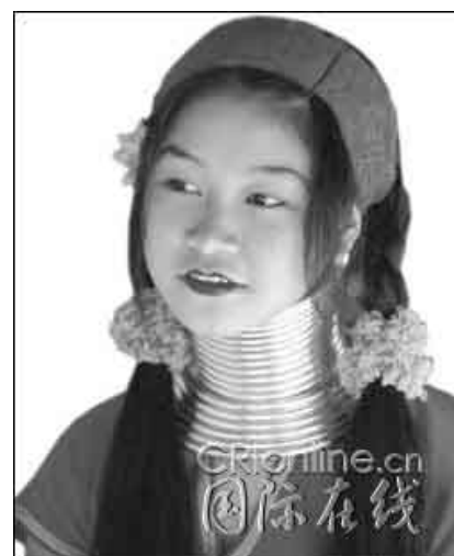
圖 2.2 長頸族

且他們長頸之廬山真面目並不會讓外人看見就連自家丈夫也不例外，清洗頸項好似神秘任務。他們拆下銅圈後的脖子上全是創傷看了令人心痛不已。若有人無意間瞥見了拆下銅圈後的脖