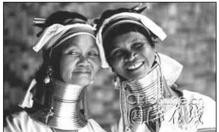
圖 2.1 長頸族

關於長頸族的由來我們已不可確切得知，但我們猜想這種文化可能是由迷信發展而來的，至今「長頸」就是他們對於美的指標。