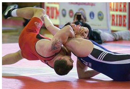
圖 5. 自由式摔角

自由式摔角是業餘摔角的一種比賽形式，源自中世紀英國的一種摔角，為當時英國騎士認識的一種武藝。自由式摔角包含關節技及反關節招，傳到美國之後把原本一些致命的危險動作改良，變成一種競技運動，之後普及到全世界，還列入奧運比賽項目。