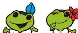
圖 12. 台北聽障奧運的吉祥物

的運動會，想必這兩項賽事會拿來比較吧。不論是聽奧或是世運會開幕典禮和閉幕典禮都讓全世界的人印象深刻，尤其是聽奧，更展現出台灣的各项風情及文化。我們在蒐集和分析資料的過程中，發現了聽奧不單單只是國際性的運動會，它代表了國際間的和平也提供了一個讓國家與國家互相交流的機會，所有的運動好手齊聚互相較量彼此分享心情，是一種非常具有意義的競爭。這場比賽吸引了來自全球各地的聽障選手來共襄盛舉，也讓全世界看見台灣是個怎樣的國家。無庸置疑地，在這個世界上，有很多身心障礙人士被人群所忽視，但透過國際性的體育賽事，他們也可以在體育場上發光發熱，讓全世界看到他們對運動的熱情是不會輸給一般人的。透過這是聽障奧運的舉辦增加了民眾對聽障人士的愛心與關懷，也讓所有人感到聽障選手無聲的力量。因為這場比賽，台灣被世界看見。因為有所有人無私的奉獻，才能完成這次的使命。舉辦聽障奧運的過程，將會成為台灣繼續向上的動力！