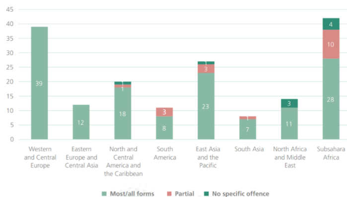
圖二：2014 人口販賣牽涉的區域

資料來源：United Nations Office on Drugs and Crime(2016). Global Report on Trafficking in Persons 2016 . Retrieved March 13, 2017, from https://www.unodc.org/documents/data-and-analysis/glotip/2016 Global Report on Trafficking in Persons.pdf