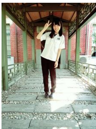
圖 6.夏季制服(黑長褲)