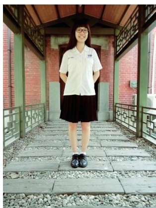
圖 5.夏季制服(百褶裙)

夏季為短款外放且側邊小開叉的短袖白色上衣，黑色的百褶裙，其長度由原來的遮膝改為蓋至膝蓋的一半，下半身亦可著黑色長褲。白色短襪與黑色皮鞋。冬季是短款外放且側邊小開叉的長袖白色上衣，黑色長褲，白色或是黑色的襪子並搭配黑色皮鞋。 8