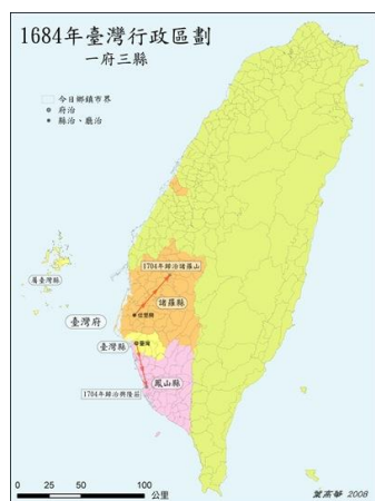
▲圖一：1684 年臺灣被清朝納入版圖。

康熙 22 年（1683 年），施琅在〈陳臺灣棄留利害疏〉中提到，臺灣雖一島，實腹地數省之屏蔽，棄之則不歸番、不歸賊，而必歸荷蘭，彼恃其戈船火器，又據形勢膏沃為巢穴，是藉寇兵而資盜糧。且澎湖為不毛之地，無臺灣，則澎湖亦不能守…，棄之必釀成大禍，留之誠永固邊疆。（註三）