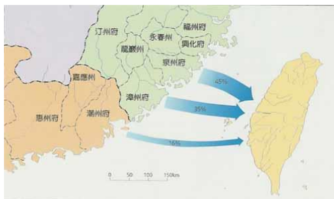
▲圖四：清代泉、漳、粵三籍移民來臺比例