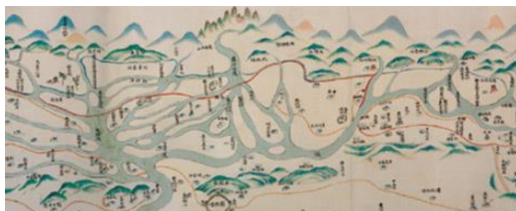
▲圖三：臺灣番界圖（局部）

清朝統治臺灣採取漢「番」隔離政策，為維護原住民的地權，又唯恐漢人勾結原住民為亂，遂禁止漢人進入「番地」。分界即一般所說的「土牛紅線」，「紅線」指地圖上用紅筆劃的界線，在地表上則是築土作堆的「土牛」與挖出來的「土牛溝」做為有形的界線。官方的界線擋不住漢人越界入墾，年代一久，界址湮滅，清廷多次重新界定番界。本圖中紅線即民番舊界，藍線為民番新定界，更往內山推移。(註六)