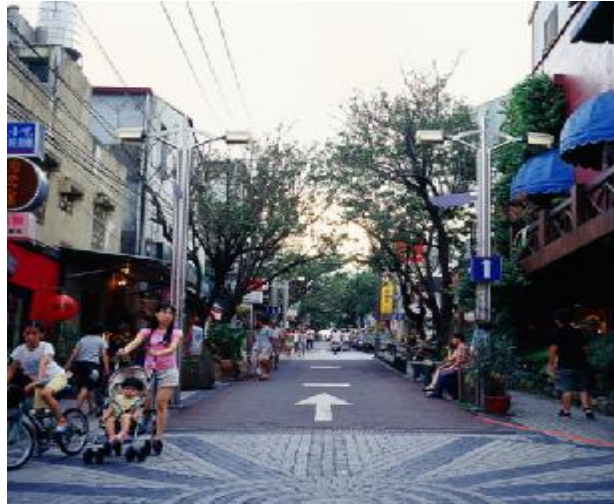
圖二：東海大學—國際藝術街