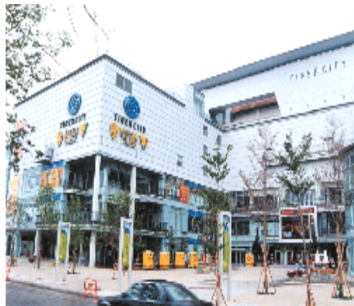
圖四：老虎城購物中心