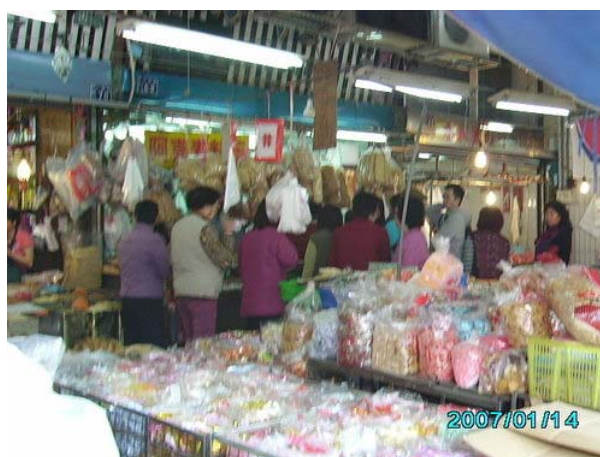
圖六、建國市場實況(註七)