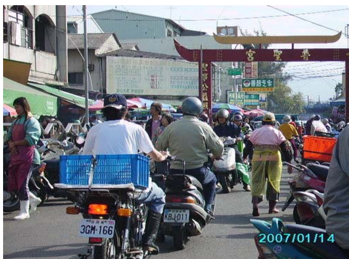
圖三 建國市場(註五)

於 921 地震之後，二樓因嚴重漏水，使的二樓的攤販和民眾甚感不便，市政府經濟局多次補漏皆無法完全改善，於是市政府在復興路四段干城商業區內的「廣兼停」公共設施預定地，斥資三百多萬建造臨時市場。